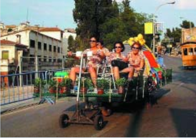
Les participants de "El càmping" es preparen per les vacances