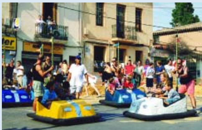
"Autos de xoc" a l'inici de la baixada