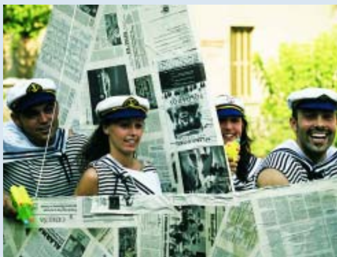
"El vaixell de paper" es prepara per baixar