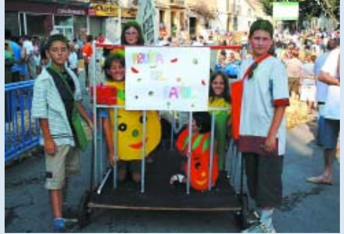
"La fruita del Papiol" abans de sortir