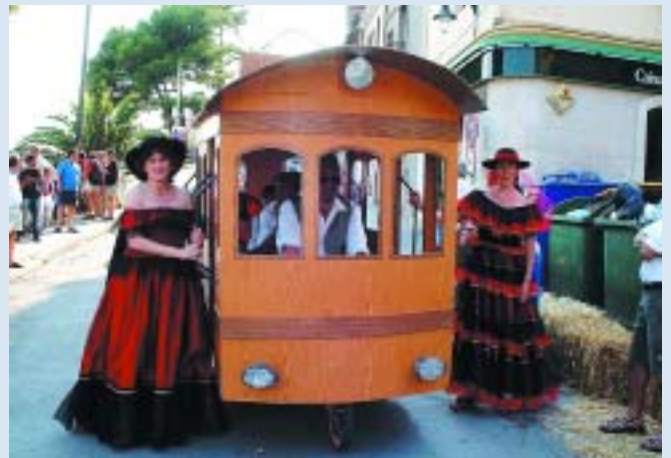
"El tramvia del Papiol" ens torna al passat