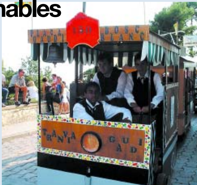
"El tramvia de Gaudí" a punt de sortir

En una festa oberta a tot el poble el proper 14 de setembre els participants, de la III Baixada seran els seus propis jutges, ja que triaran ells mateixos, els vehicles guanyadors.