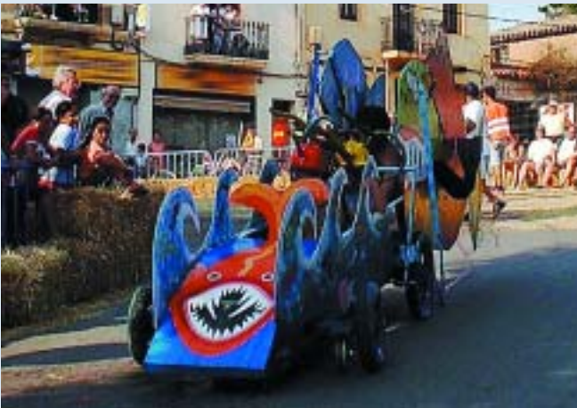
Per un dia El Papiol va poder gaudir del mar amb el "Girapop"