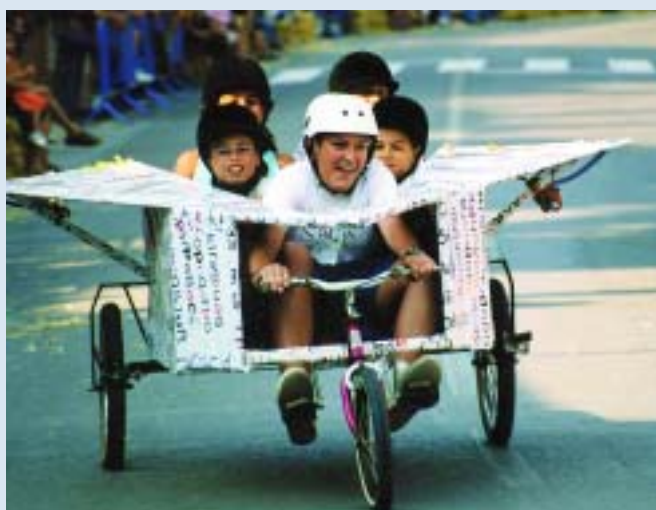
"L'avió de paper" va ser el vehicle més ràpid