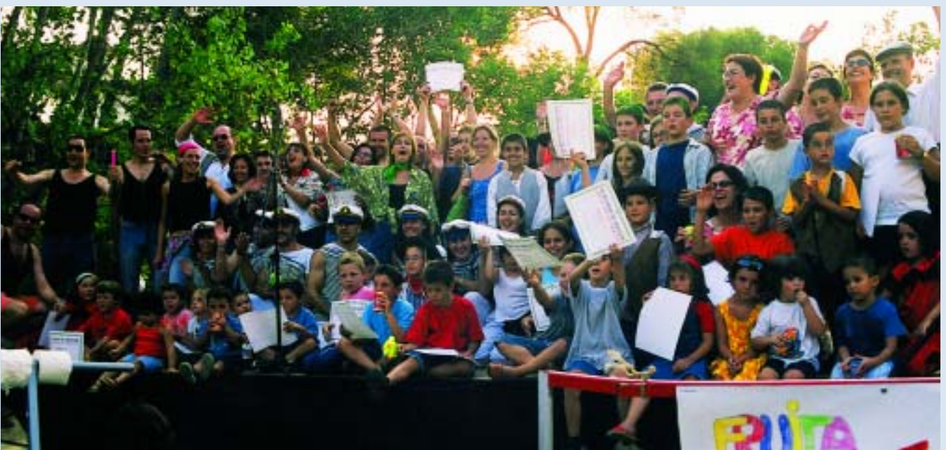
Tots els participants van rebre un diploma