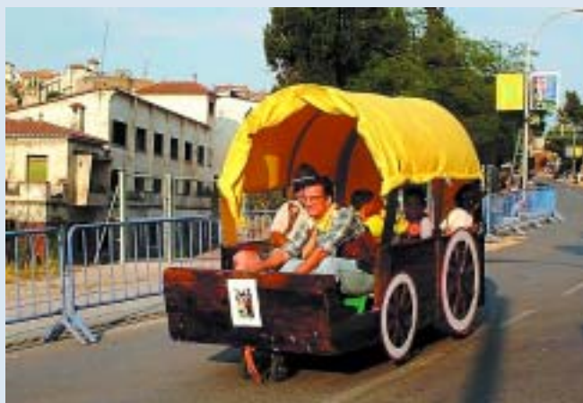
La caravana en busca del cavall perdut, "marxa de vacances"