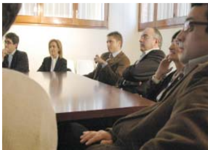
Imatges de la visita del Conseller Bargalló: rebuda a l'Ajuntament, firma al llibre d'honor i reunió amb tots els regidors a la Sala de Plens