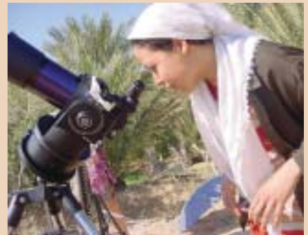
Una jove tunisiana embadalida amb l'eclipsi passat

Aquí l'eclipsi començarà a les 11 hores 22 minuts; el màxim serà a les 12 hores 21 minuts i el final a les 13 hores i 23 minuts. A la zona de Barcelona la parcialitat arribarà a l'entorn del 43% d'ocultació del disc solar, molt menys que el del passat 3 d'octubre, que va assolir més del 80%. Aquesta ocasió el grau de foscor de l'ambient pot ser que passi desaperce-