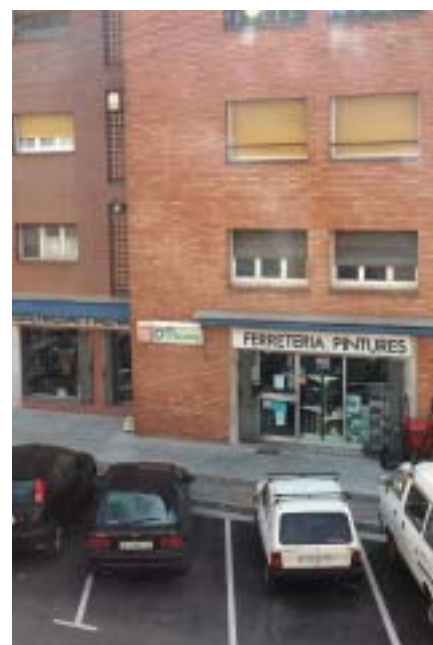
Aparcament de l'Avinguda Generalitat