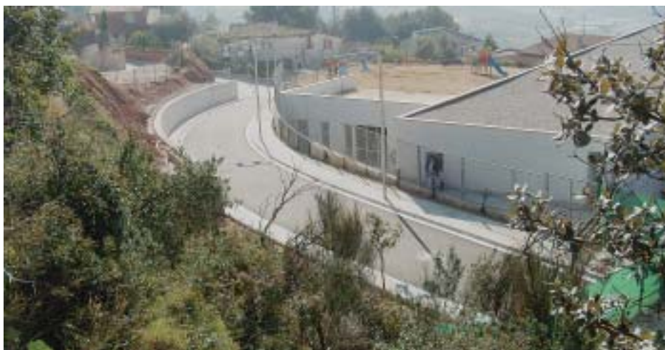
Pel carrer Jaume I es pot accedir a peu pla a l'escola Pau Vila

Les obres del Carrer Jaume I ja han acabat i actualment s'ha obert el carrer com a espai per a vianants per a utilitzar-lo com a via d'accés a peu pla a l'escola Pau Vila. L'obra que ha comptat amb un pressupost de 125.000 euros ha tingut un temps d'execució de 5 mesos, des de setembre de 2005 a gener de 2006. Al carrer s'ha apostat per col·locar-hi unes enfiladisses d'heura. Quan arribi el bon temps, les enfiladisses hauran crescut i crearan un mantell verd que farà molt més agradable la passejada per anar a portar els nens i nenes a l'escola.