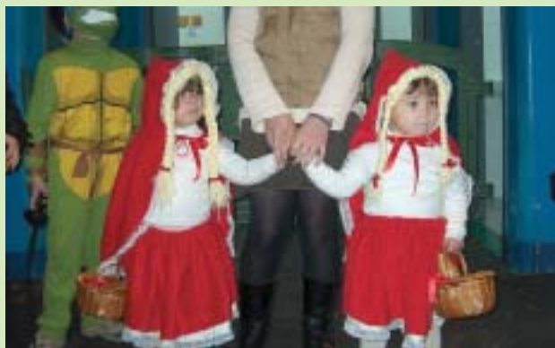
Les caputxetes vermelles del Carnaval infantil

El diumenge 26 al migdia va tenir lloc el Carnestoltes infantil. Els més menuts van passejar les seves disfresses pel Pavelló Municipal amb alegria, malgrat el mal temps va obligar a anul·lar la rua del carnestoltes que havia de desenvolupar-se pels carrers del poble.