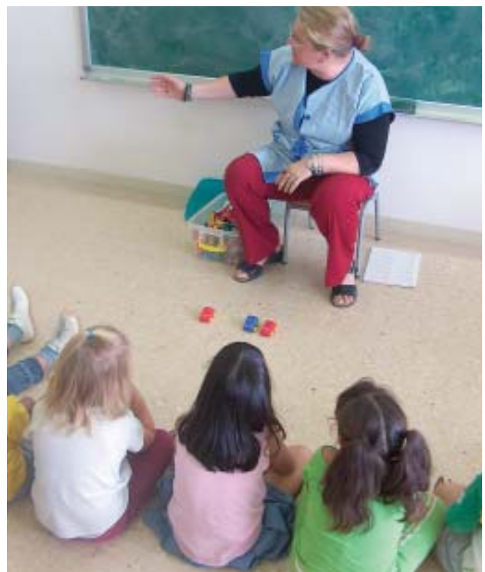
Classe a l'escola Pau Vila