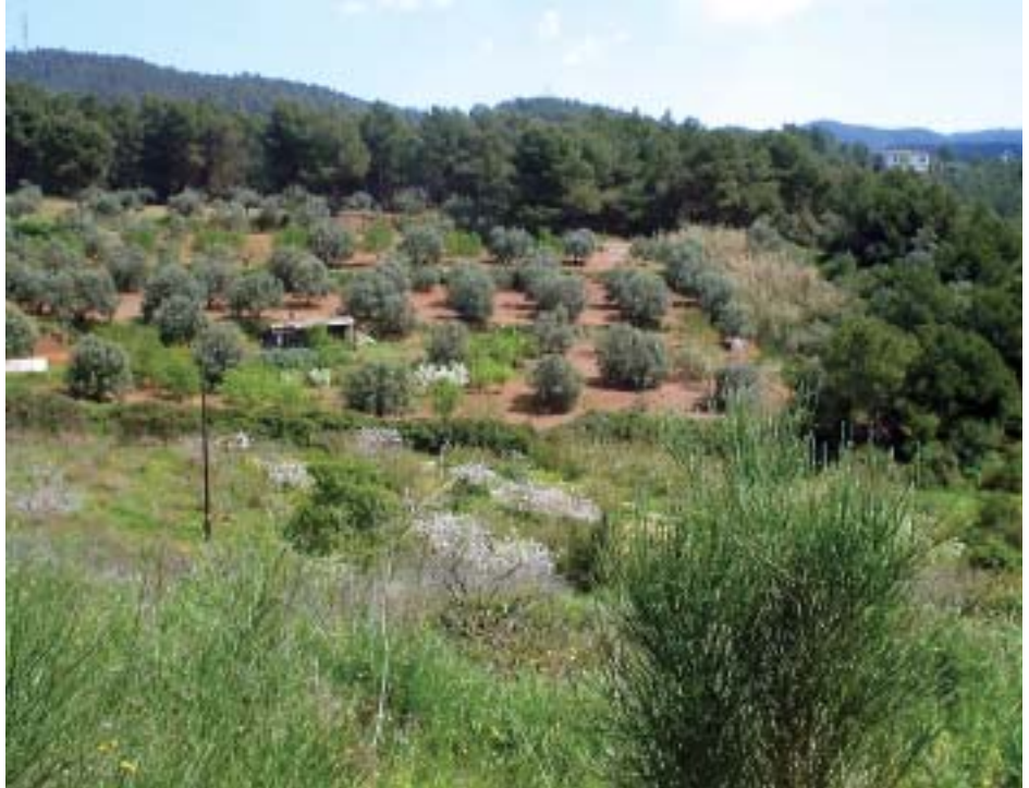
Parc de Collserola

Sembla estrany que, en la situació actual, en que no hi ha un problema de mala comunicació entre els municipis