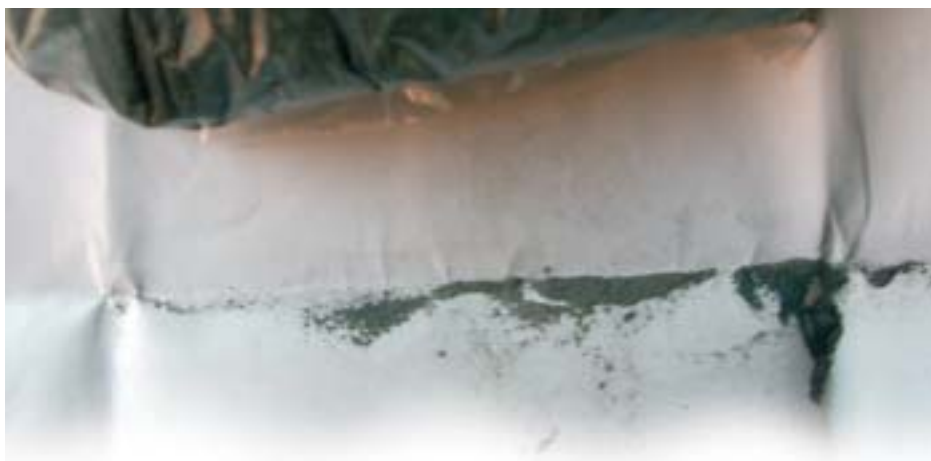
Mostra de pols enviada per un veí a l'Ajuntament

L'Ajuntament, des de l'alcaldia i la regidoria de Medi Ambient i conjuntament amb els altres municipis afectats, està treballant per definir les responsabilitats d'aquesta contaminació ambiental i aconseguir que s'aturi. Actualment s'han tingut dues reunions amb la Direcció General de