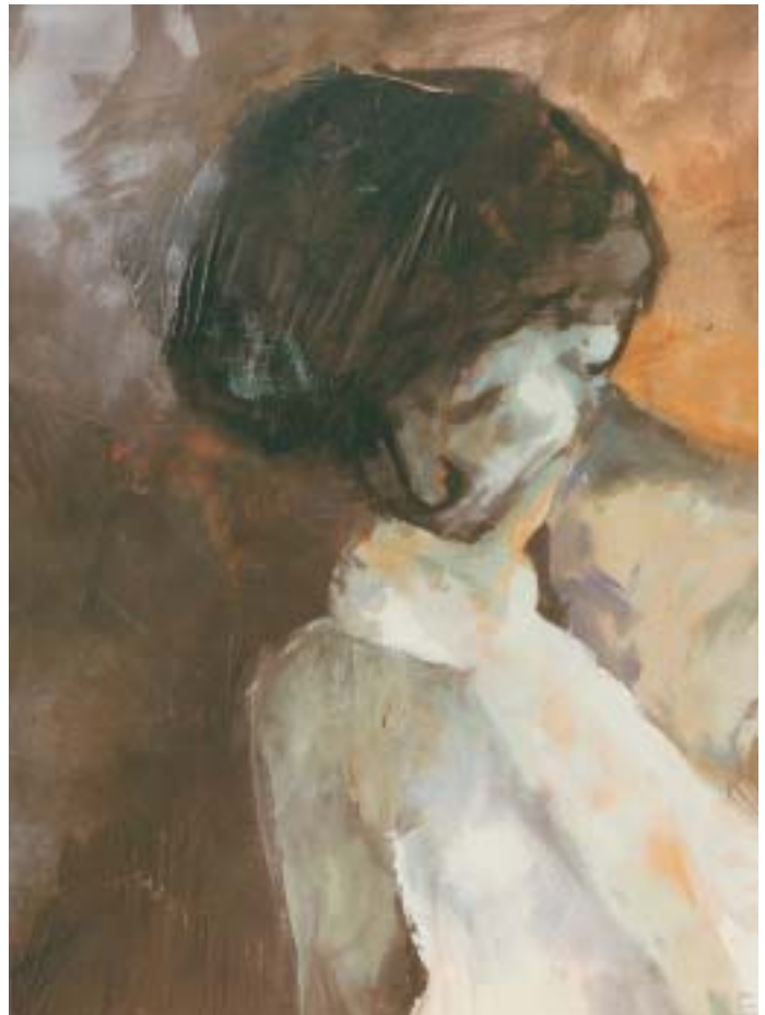
Il·lustració de Maria Solé