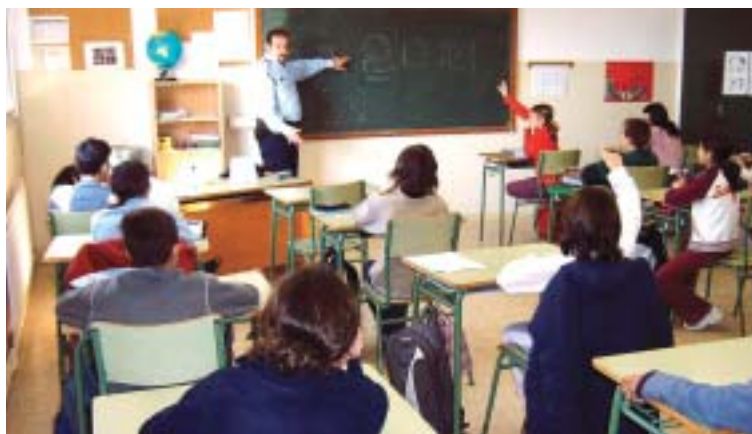
Moment de les Jornades d'Educació Viària

La Policia Municipal del Papiol realitza diferents trobades amb els alumnes de l'escola Pau Vila per informar-los sobre les normes de circulació i sensibilitzar-los respecte a la bona convivència a la carretera. Els nens també aprofiten el torn de preguntes per a demanar informació sobre el mateix cos de la Policia Municipal, l'Ajuntament, el poble o la llei del Tabac. Al finalitzar les sessions els alumnes reben un diploma de record.