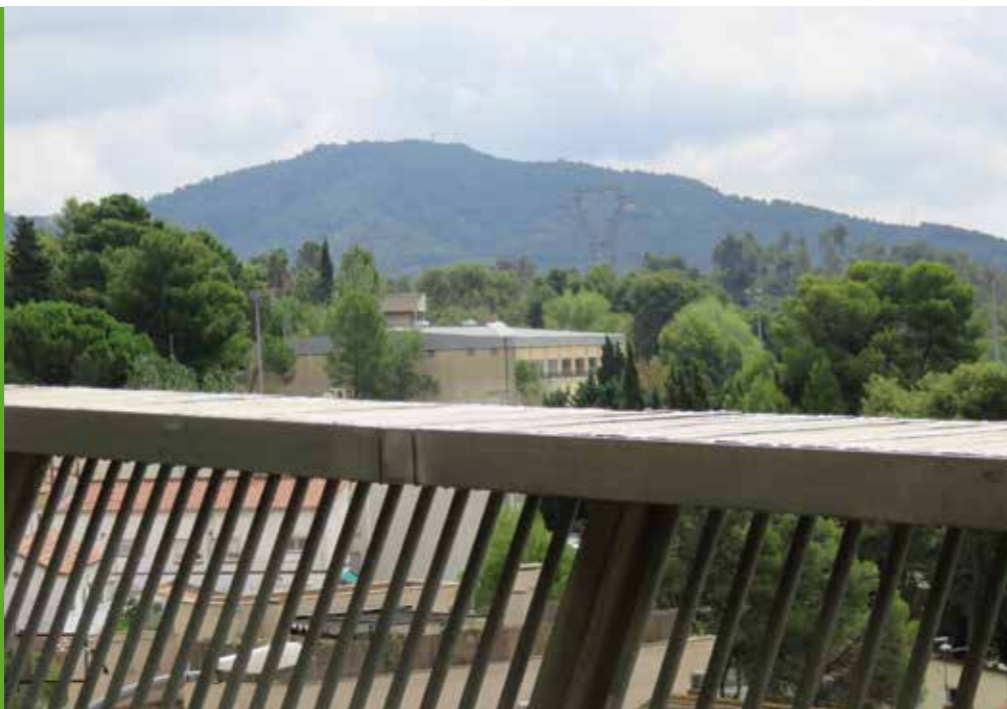
Vista del Poliesportiu des del mirador del carrer del Carme.