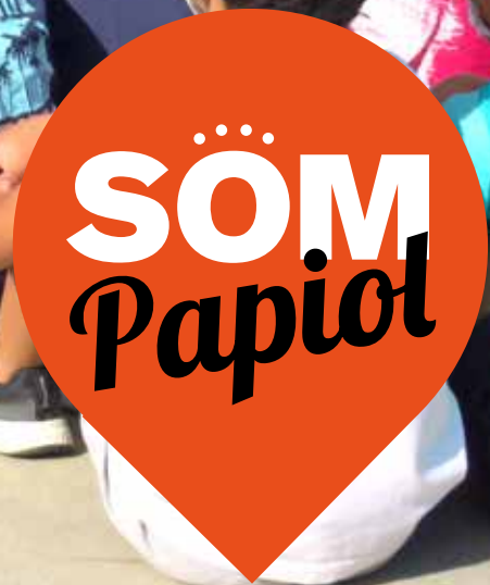
Foto: activitat lúdica sobre el reciclatge a l'Escola Pau Vila.