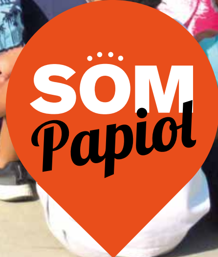
Foto: activitat lúdica sobre el reciclatge a l'Escola Pau Vila.