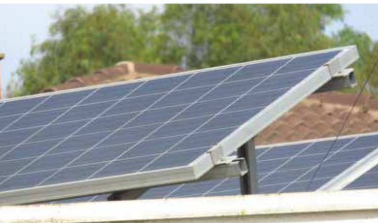
Plaques solars de l'Escola Pau Vila, estrenades l'inici del curs 2017-2018.

L'Ajuntament ha constatat un interès notable i a l'alça per la instal·lació de plaques fotovoltaïques per part de veïns i veïnes i, amb l'objectiu de vetllar pel medi ambient, el plenari municipal ha aprovat una modificació de l'ordenança de l'Impost sobre Construccions, Instal·lacions i Obres (ICIO): si algú vol col·locar plaques solars al sostre de casa seva, tindrà una bonificació del 95 % en l'impost d'obres.